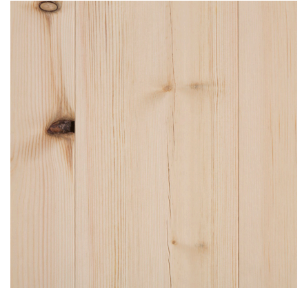
Kvistutslag. Sprickor i yta.

Friska kvistar och mörka kvistar. Markerande och större barkdragande kvistar. Kvistutslag samt mindre sprickor förekommer. Bilden visar 18x170 mm, obehandlat.