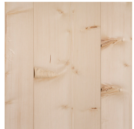
Utslag i och runt kvist. Sprickor i yta.