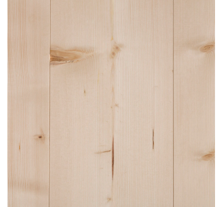
Utslag. Märgstråle. Kärlåpa.

Friska och mörka kvistar med mer markerande barkdragande kvistar. Kvistutslag, sprickor och andra naturliga ingredienser förekommer i varierande antal och storlek. Bilden visar 30x230 mm, obehandlat.